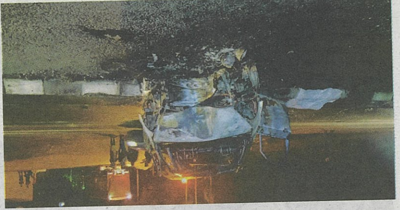
KEADAAAN kereta dinaiki tiga beranak yang rentung.

menimpunya, dia akan terus bekerja selepas ini.