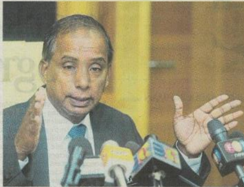
Human Resources Minister M. Kulasegaran at a press conference in Putrajaya yesterday.

Other laws which will see changes are the Minimum Stan-