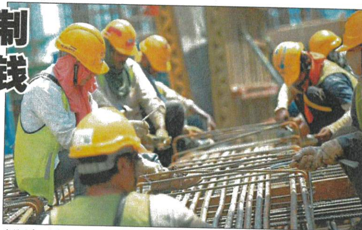
内阁同意于今年7月1日起，所有工商领域重启替代外劳机制，获工商组织一片赞好。因为建筑劳工正在烈日下辛勤工作。

古拉认为，这样的机制不会导致外劳增加，而是维持已批准雇主的外劳人数，不仅省时省钱，还能进一步解决各行各业外劳短缺问题，同时确保生产力和出口不受影响。